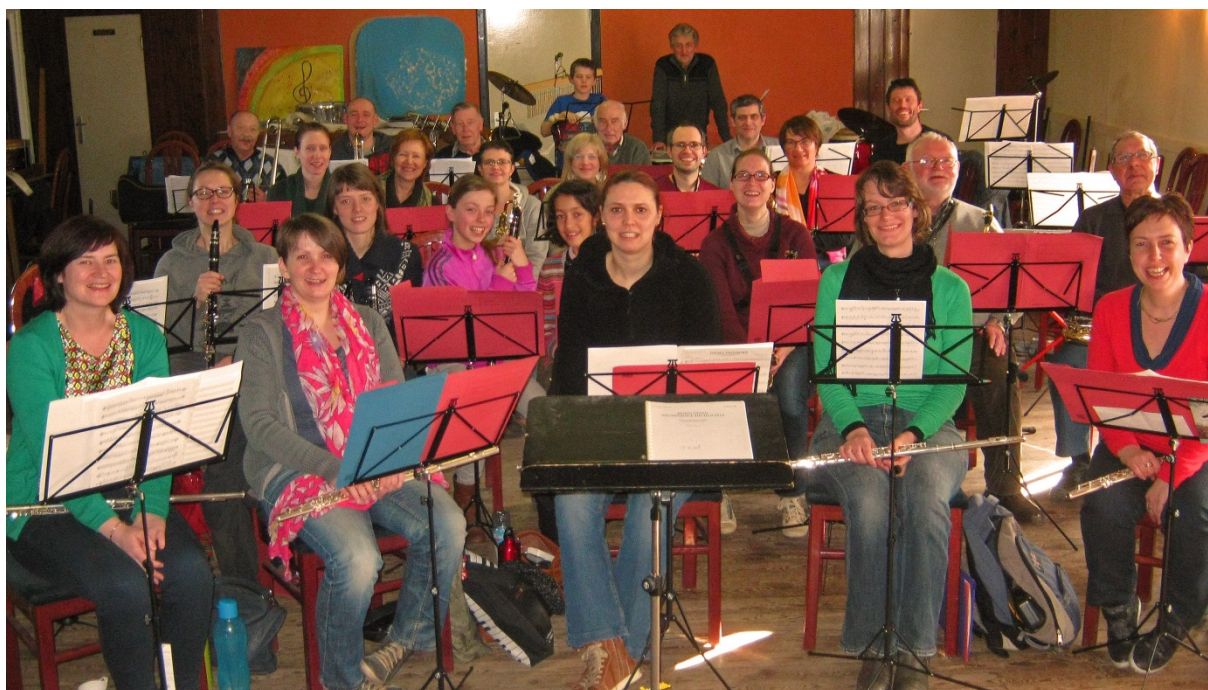
Repeteren met de glimlach en met veel muzikale zon in het hart